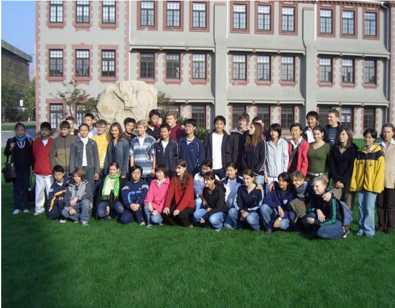
Die deutschen und chinesischen Austauschpartner vor der Shidong-Schule

(aber auch vor einige Probleme stellt!), ist der Wunsch der chinesischen Seite, mit 40 neugierigen und an der deutschen Kultur interessierten jungen Menschen zwischen 15 und 17 Jahren nach Staufen zu kommen. Da wir natürlich niemandem diesen Wunsch