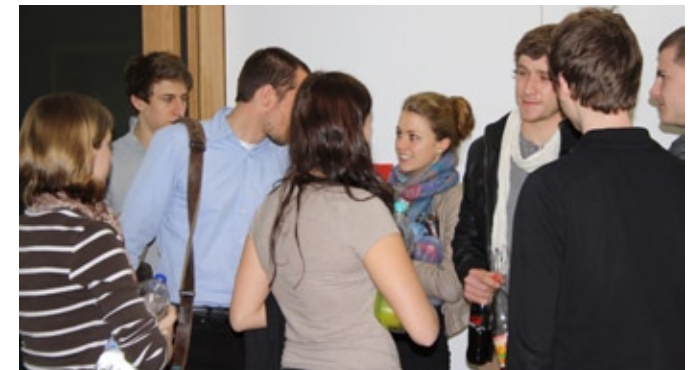
Die ersten zufriedenen Gesichter