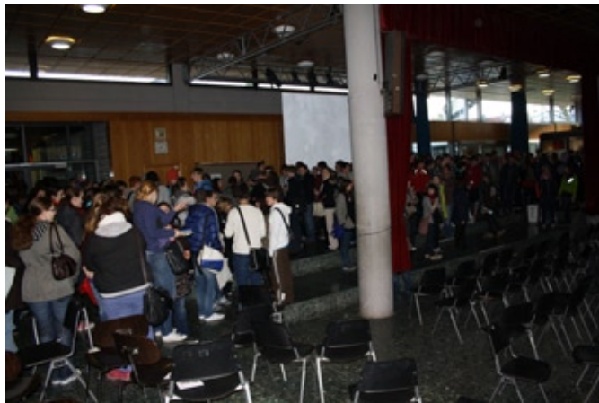
232 Abiturient/innen - bevor es los geht.

strahlt. „Gut. Eigentlich alles ganz in Ordnung.“ Totale Ruhe hier im Westflügel. Geschrieben wird