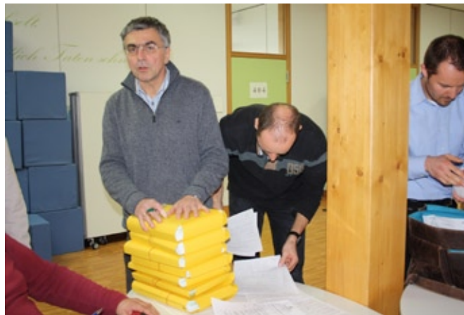
Oberstufenberater beim Sammeln der Arbeiten

acht Jahren mit mehr Nachmittagsunterricht. Wir haben das Ding geschaukelt. Also die Schüler/innen natürlich in erster Linie. Das Doppeljahrgangabitur hat nun tatsächlich