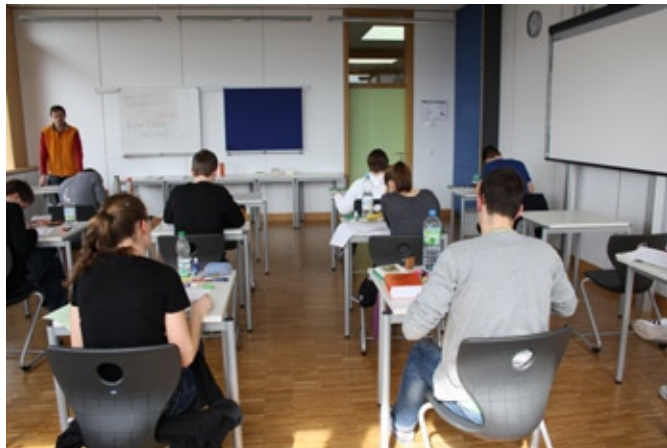
Einzeltische - Aufsicht vorne und hinten

auf drei Etagen. G8 und G9 zusammen. Ob man die Altersunterschiede bemerkt? Nur wenn man die Leute kennt. Mein erster G8 Jahrgang als Fünftklass-Klassenlehrer macht hier mit. 5b hieß sie damals. Der wundervolle Rotwein mit den vielen Unterschriften, die ich Ende der sechsten Klasse bekommen habe, darf jetzt bald geöffnet