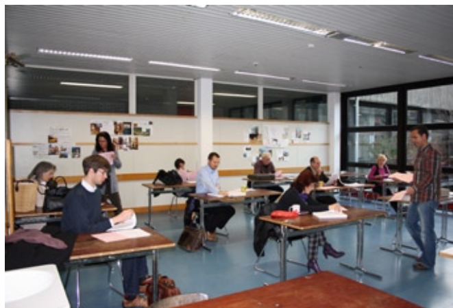
Deutschlehrer/-innen beim Öffnen der Abituraufgaben

(Ein paar Gedanken bei der Fluraufsicht)