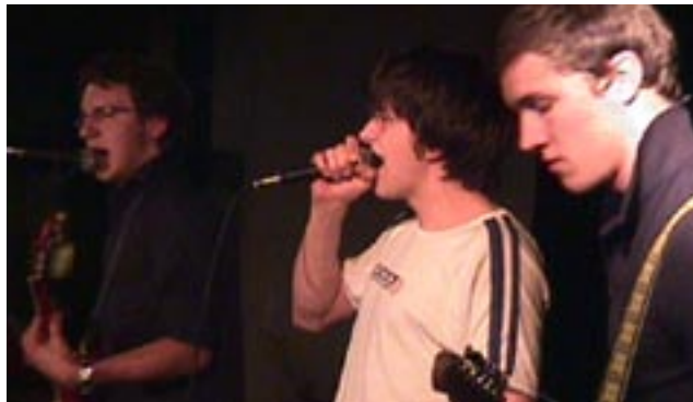
Flapjack im Kultcafé