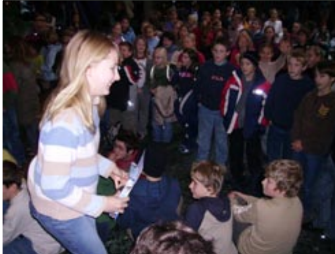
Siegerehrung, Sieger und Publikum