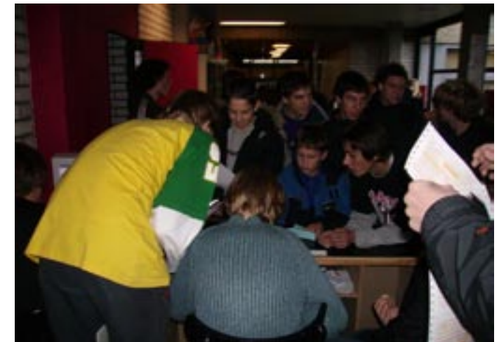
Anmeldung zu den SnowDays am SchüBo