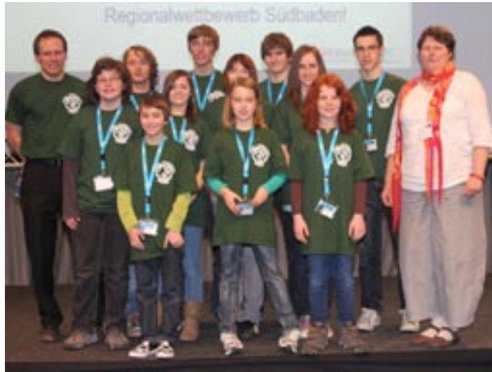
DAS ERFOLGREICHE JUFO-TEAM DES FAUST-GYMNASIUMS STAUFEN