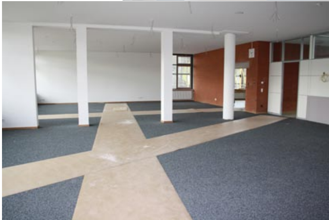
Nach Ostern wird das neue Lehrerzimmer bezogen

Liebe Eltern, liebe Kolleginnen und Kollegen, liebe Schülerinnen und Schüler, liebe Freunde des Faust